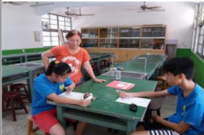
活動照片 1：老師檢視學生讀寫族語的能力。