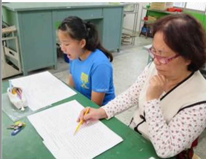
活動照片 3：學生反覆練習族語朗讀比賽。