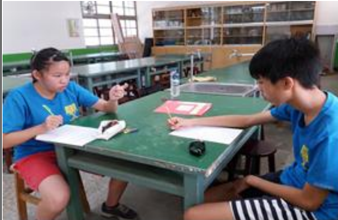
活動照片 2：學生專心討論學習單。