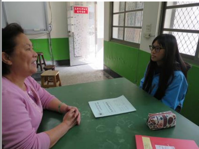
活動照片 1：老師和學生一對一練習對話。