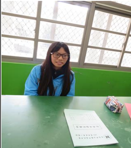
活動照片 2：學生樂於學習自己的母語。