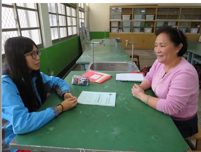
活動照片 3：學生自信地展現對話能力。