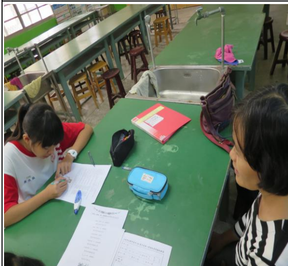
活動照片 1：老師用心指導學生讀寫族語的能力。