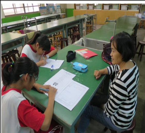
活動照片 2：老師自製學習單讓同學看圖寫出族語。