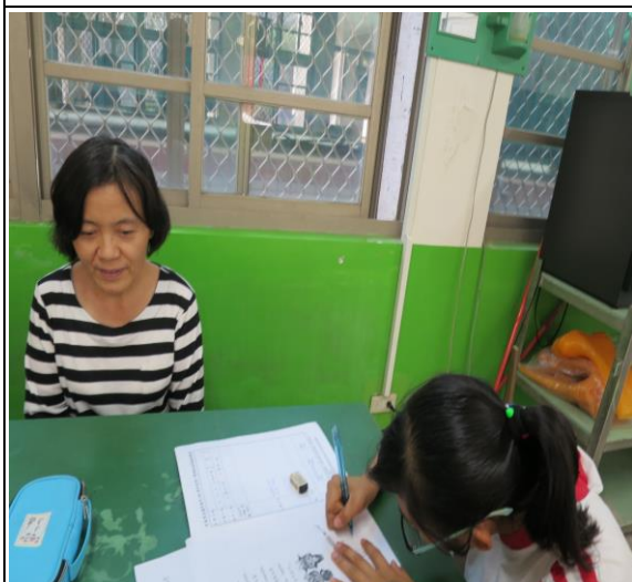
活動照片 3：學生用心完成學習單。