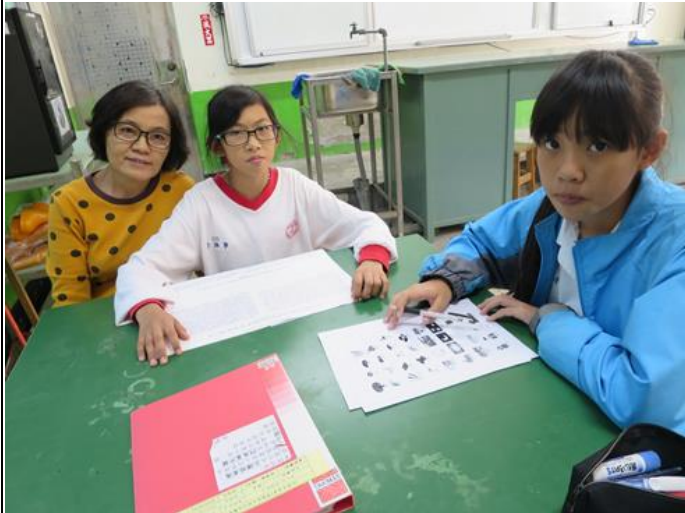
活動照片 1：老師自製學習單讓同學看圖說族語。