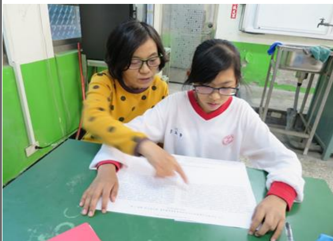
活動照片 3：老師親切指導學生逐字逐句說族語。