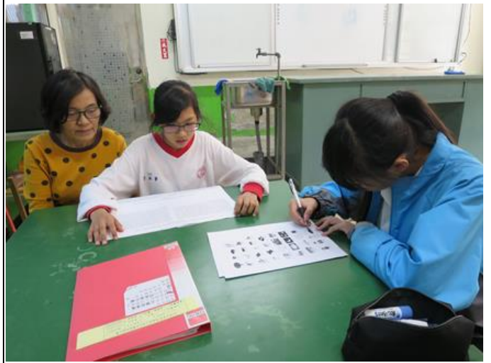
活動照片 2：老師自製學習單讓同學看圖寫出族語。