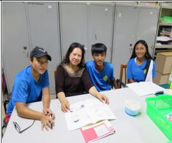
活動照片 2：期末族語同樂會！