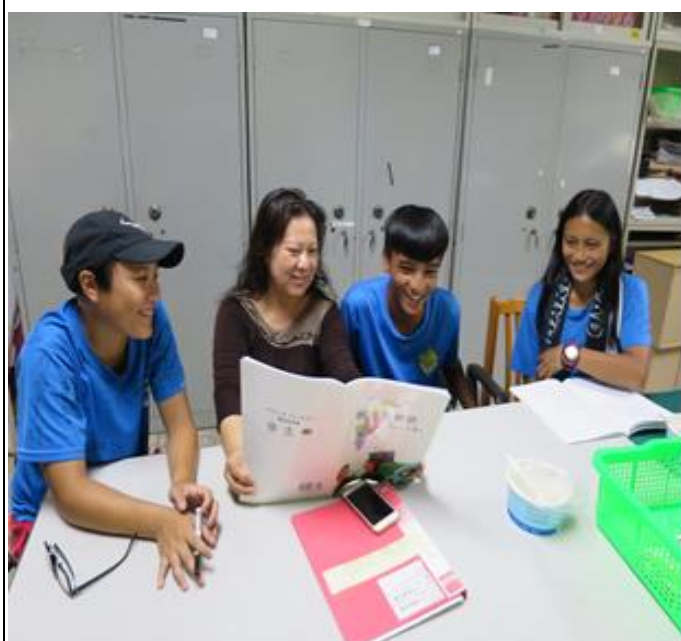
活動照片 3：學族語，真開心！