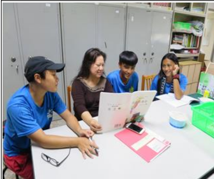
活動照片 1：三位布農族的學生進行混齡教學。