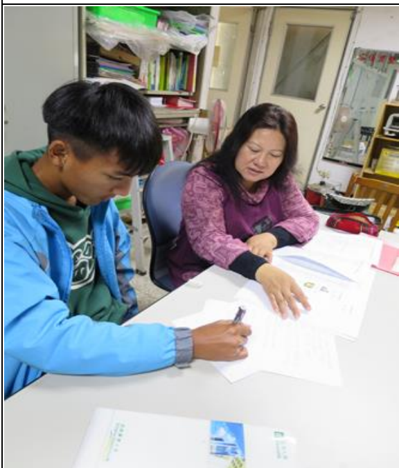
活動照片 3：老師耐心逐字逐句教導。