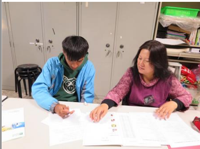
活動照片 1：老師以圖片引導族語學習。