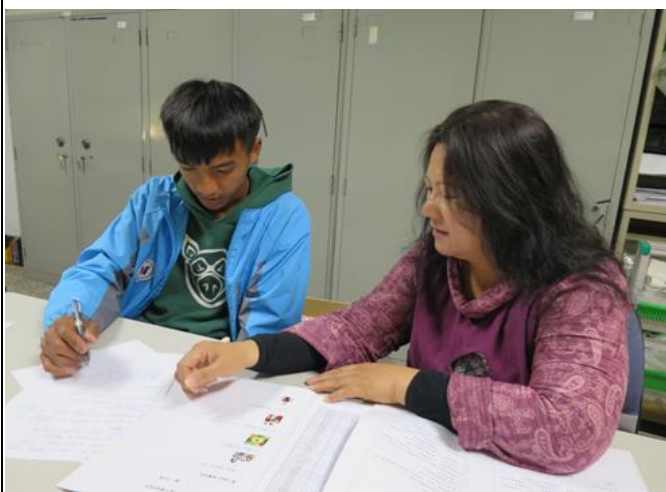
活動照片 2：學生同時學寫族語。