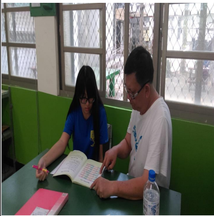
活動照片 3：老師教導短文的念法。