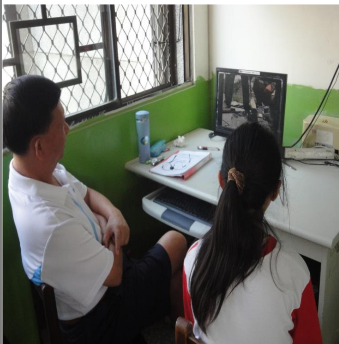
活動照片 1：看影片，學族語。